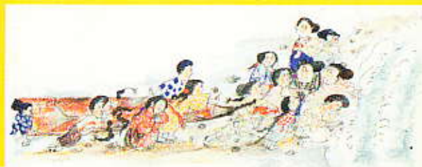
瀬川康男「おもしろいおとこ」(1963年) BIB1967 グランプリ 原画/イラスト