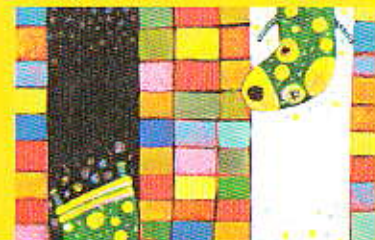
アリ・レザ・ゴルドゥジャン「穴のおとこ」(2003年) BIB2005 グランプリ Shebavi 原画/イラスト: Ali Reza Goldouzi