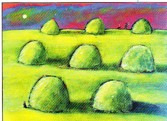
ERIC BATTUT, Grand Prix BIB 2001, France ERIC BATTUT, Grand Prix BIB 2001, France

La BIB, conformément aux décisions et objectifs de l'UNESCO et de ses organisations internationales associées, notamment en coopération avec les sections nationales du Conseil international de livres pour les jeunes – IBBY, crée des conditions pour leur évaluation et contribue de cette façon au développement de ce genre d'art. Aux 18 expositions de la BIB ont participé 5 071 illustrateurs de presque 100 pays