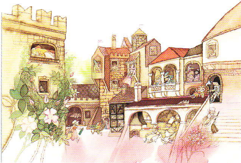
Iuba Kancokova Vesela da "Rozprávky nad zlato" (c) Ed. Mladé letá, Bratislava

Un'ampia sezione della Mostra è dedicata quest'anno alla Slovacchia, un Paese che oggi si distingue per un'attività culturale e museale particolarmente intensa che lo proietta verso il futuro. Da ormai trent'anni Bratislava è sede di un appuntamento fondamentale per gli illustratori e gli editori di tutto il mondo: la BIB, la Biennale Internazionale con la quale quest'anno la Mostra di Sàrmede ha instaurato un fertile rapporto di collaborazione.