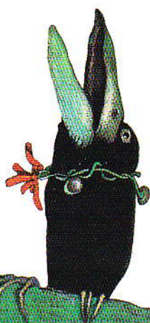
John Rowe da "Raben Baby" |c| Neugebauer Verlag Gossau, Zurigo

Ospite d'onore a "Le immagini della fantasia" edizione 1996 è John Rowe. Artista inglese di grande rilievo, in questi ultimi anni ha ottenuto importanti riconoscimenti alle principali manifestazioni internazionali nel campo dell'illustrazione per l'infanzia: ha vinto il primo premio alla BIB di Bratislava nel 1995 e quest'anno ha avuto un'attenzione speciale all'interno del catalogo della Fiera del Libro per ragazzi di Bologna. Nell'ambito di questa manifestazione è stato incluso nella rosa dei trenta migliori illustratori del mondo degli ultimi trent'anni. Gli animali sono i personaggi prediletti di John Rowe che spesso scrive anche i testi delle favole che illustra.