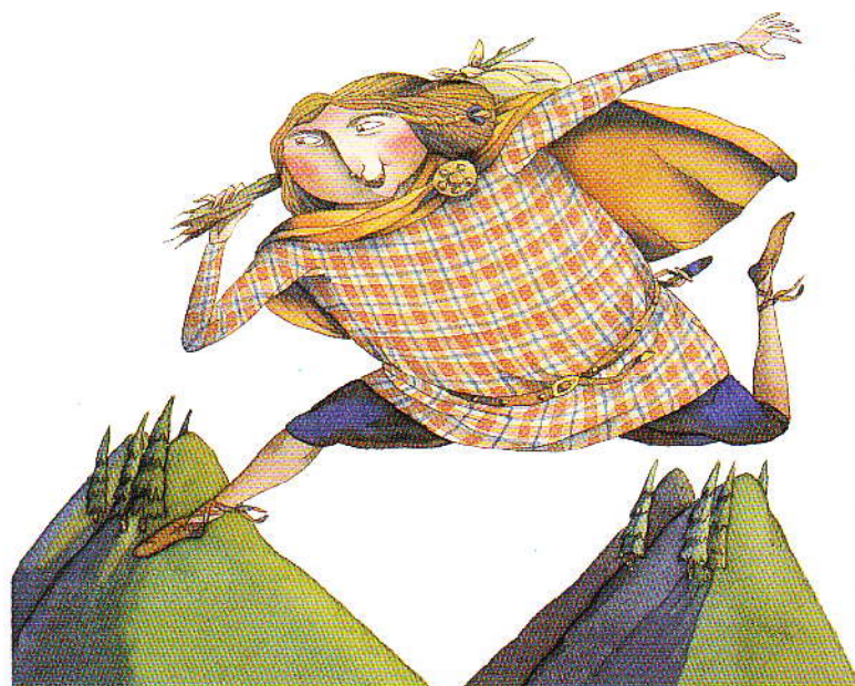
Giovanni Manna da "Il gigante Finn" [a] Ed. C'era una volta, Pordenone

Bambini e insegnanti sono i referenti diretti dell'esperienza della Mostra, in una società in cui, grazie anche al contributo di Sàrmede, l'illustrazione non viene più considerata solo come accompagnamento di un testo, ma si sviluppa autonomamente, creando un filone di varie espressioni artistiche ad un livello qualitativo mai raggiunto finora. Accanto alla Mostra si sono sviluppate altre iniziative: i corsi di specializzazione per illustratori nei mesi di giugno e luglio, attività seminariali, laboratori e manifestazioni teatrali per l'infanzia culminanti a Sàrmede nelle "Fiere del Teatro".