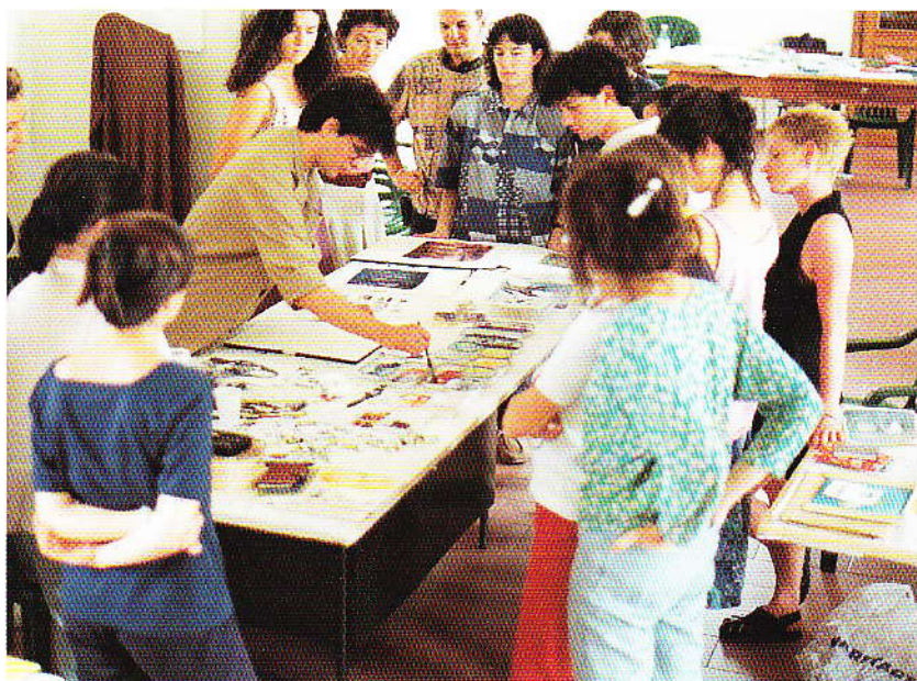
Květa Pacovská da "Flying" (c) Neugebauer Verlag Gossau, Zurigo

Parte integrante dell'attività di Sàrmede sono i corsi della Scuola estiva d'illustrazione, diretti da Štěpán Zavřel. Ogni anno vengono selezionati una ottantina di allievi che vogliono perfezionarsi ed avvicinare con serietà il mondo dell'illustrazione per l'infanzia. I corsi, che approfondiscono alcune tecniche pittoriche (tempera acrilica, acquerello, incisione) sono veramente intensivi: gli allievi infatti sono impegnati dalla mattina sino a tarda sera con prove pratiche intervallate da momenti di approfondimento teorico e da verifiche collegiali. Non sono pochi coloro che, dopo aver frequentato i corsi di Sàrmede, hanno scelto, con successo, di fare dell'illustrazione per l'infanzia una appassionata scelta professionale.