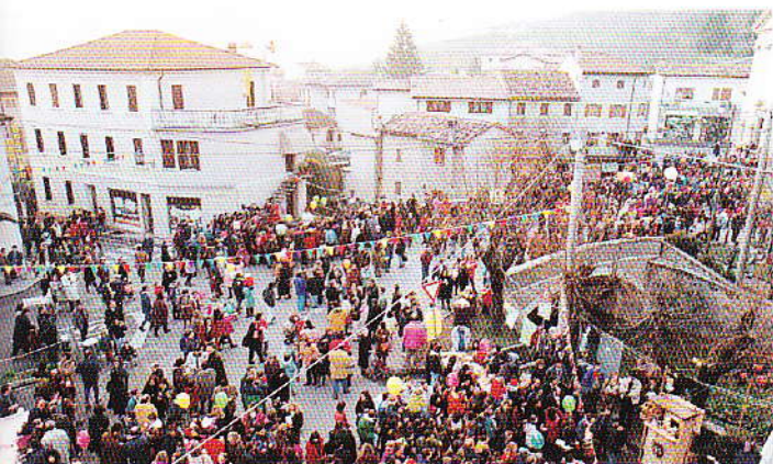
La piazza di Sàrmede

Laboratori sull'illustrazione per insegnanti