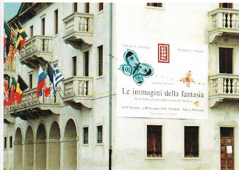
Il Palazzo Municipale di Sàrmede, sede della Mostra

Istanbul, Vienna e Monza. Dal 1990 l'appuntamento trevigiano è ospitato nella suggestiva sede della Casa dei Carraresi dalla Cassamarca, che contribuisce alla realizzazione della Mostra fin dal 1985.