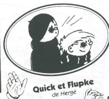
Quick et Flupke de Hergé