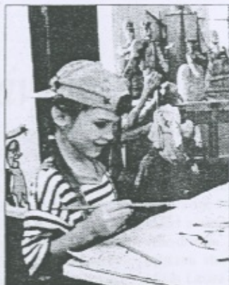
Pri prácach študentov VŠMU si svoju výtvarnú zručnosť môžu vyskúšať aj tí najmenší.

Prvá písomná zmienka o bábkovom divadle siaha do 9. storočia p. n. l. Nachádza sa v texte indického eposu Mahabharata. Prvý európsky písomný záznam o bábkovom