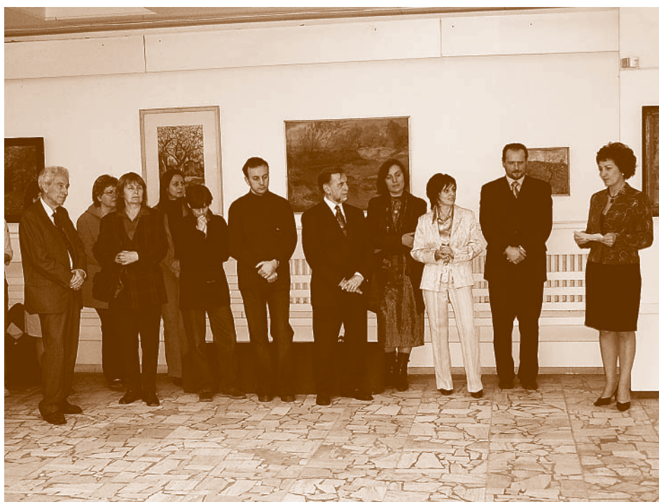
Slávnostné stretnutie pri príležitosti Dní detskej knihy v priestoroch Hornozemplínskeho osvetového strediska

Prijemným osviežením bolo divadelné vystúpenie, ktoré pripravilo Centrum voľného času vo Vranove. Nasledovala prehliadka vysunutej expozície Vlastivedného