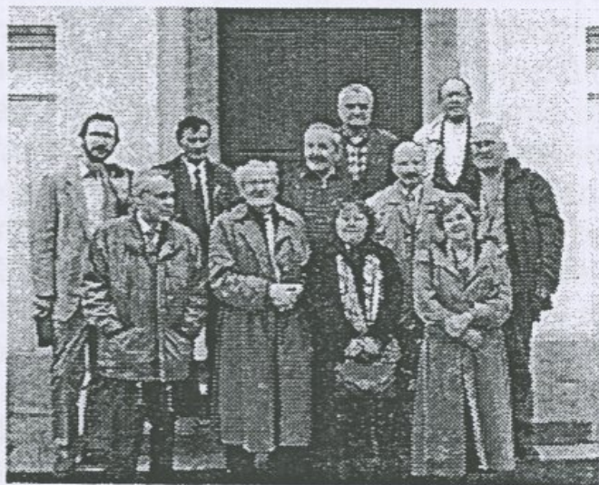
Spisovatelia pred kaštieľom v Budimíre

Týždeň detskej knihy však obsahoval aj celoslovenský seminár „Počítače a multimédia v práci s detským čitateľom“, ktorý sa 13. apríla uskutočnil v priestoroch pobočky KMK na ZŠ Užhorodskej. Tu sa 55 účastníkom seminára prihovorili odborníci z Univerzity Komenského