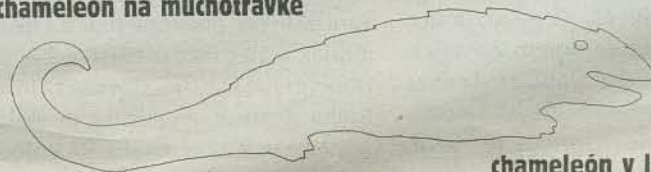
chameleón v lístí