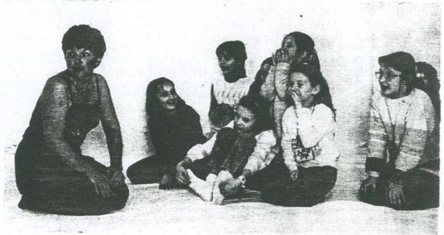
E. ČARSKÁ S DEŤMI

Jedného dňa šla Taffy s otcom chytat ryby. Otcovi sa zlomil oštep a Taffy prišla na myšlienku, že pošle po cudzincovi, ktorý práve prechádzal okolo, odkaz mame, aby poslala nový oštep. Ale keďže Taffy nevedela písať, nakreslila odkaz žraločím zubom na kôru brezy.