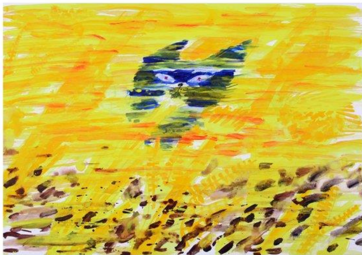
ZLATÉ JABLKO BIB JAPONSKO: ŽLTÁ A JA