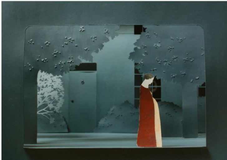
ZLATÉ JABLKO BIB SPANIELSKO: FRANKENSTEIN