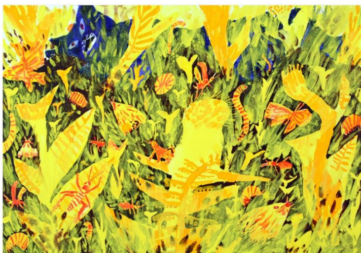
ZLATÉ JABLKO BIB JAPONSKO: ZLTA A JA