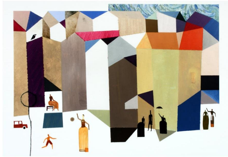
ZLATÉ JABLKO BIB ŠPANIELSKO: VTÁK V KLIENTKE