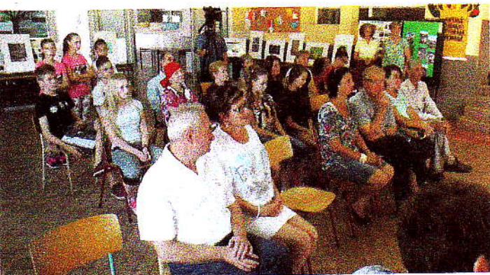
Zo sobotnej slávnosti v Silbaši