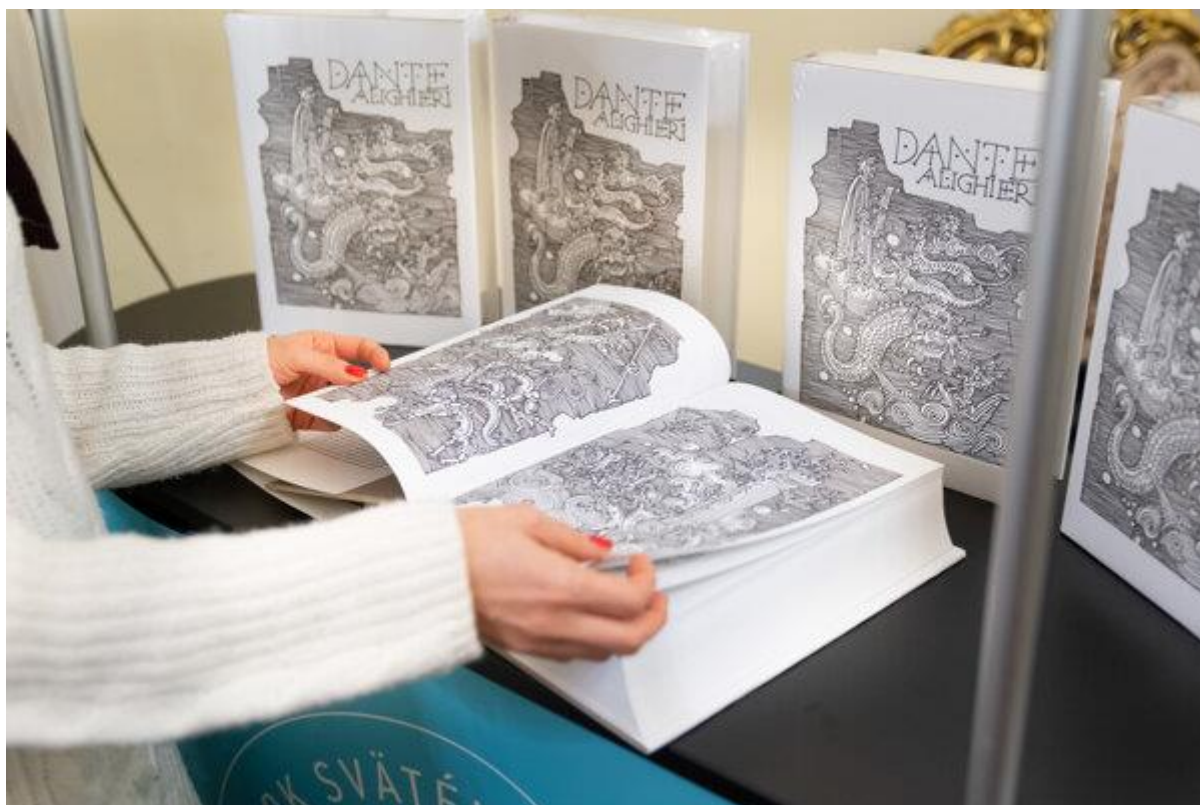
Najkrajšia kniha Slovenska je Božská komédia.

BRATISLAVA. Najkrajšou knihou Slovenska za celkovú výtvarnú a technickú kvalitu sa za rok 2019 stala Danteho Božská komédia.