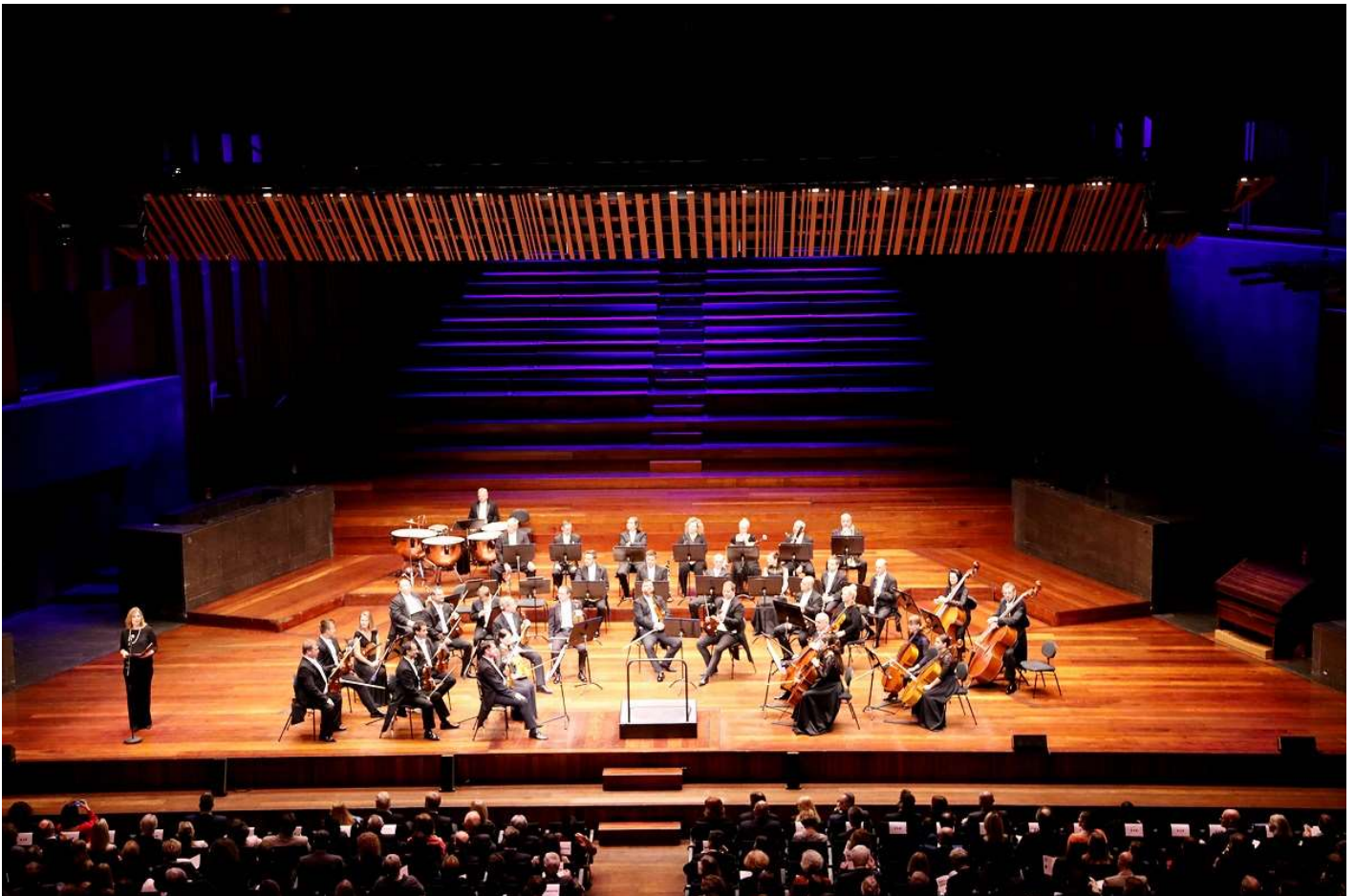
Otvorenie koncertu Štátneho komorného orchestra Žilina.